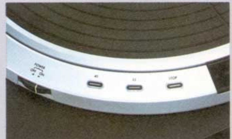
Berührungssensoren für Drehzahl und Schnellstopp